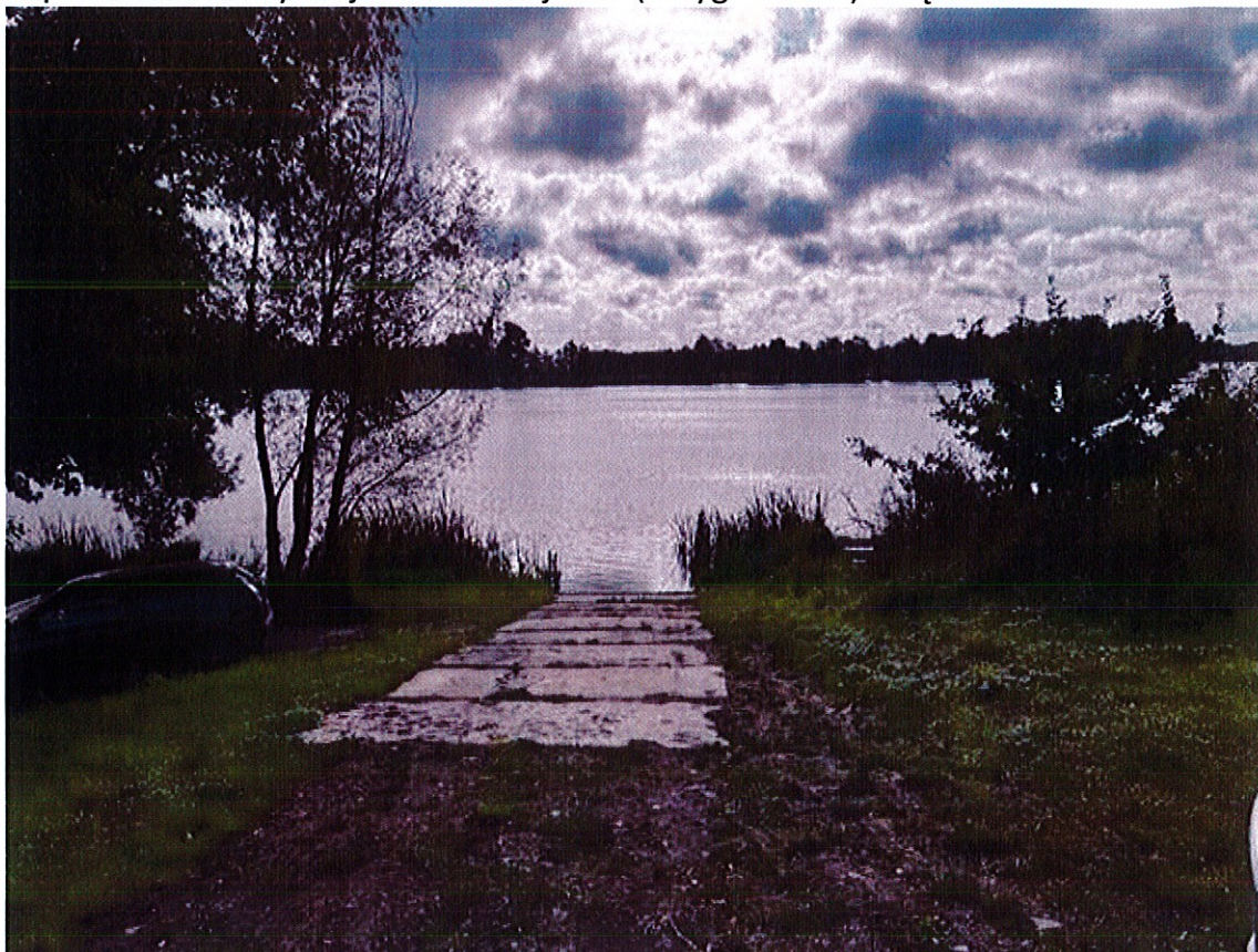
Slip zlokalizowany na jeziorze Miejskim (Trzygłowskie) załącznik nr 2