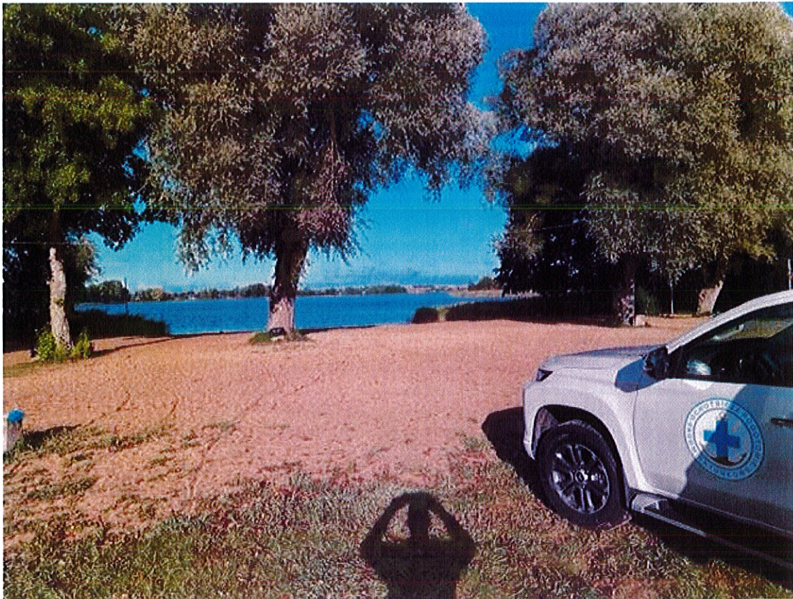
Zdjęcia z BSP